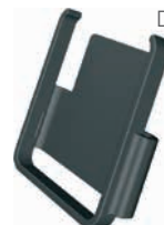
Držák do auta