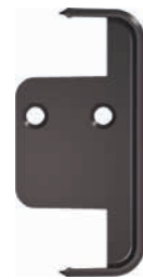
Držák do auta.