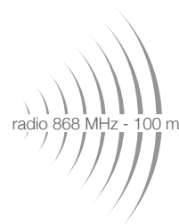
radio 868 MHz - 100 m